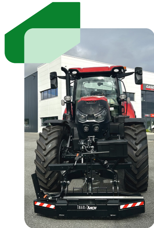
Pack TM 2 500 • Pack TM 2750 • Pack TM 2 900