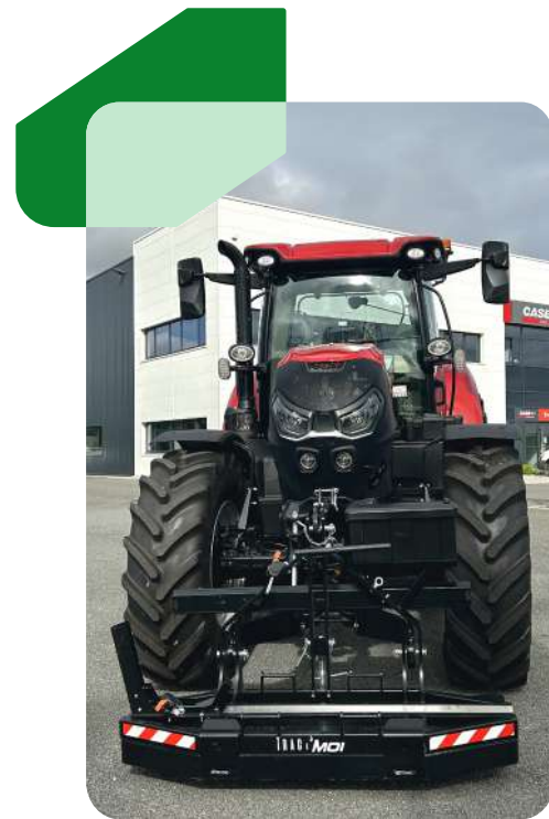
Pack TM 2 500 • Pack TM 2 750 • Pack TM 2 900