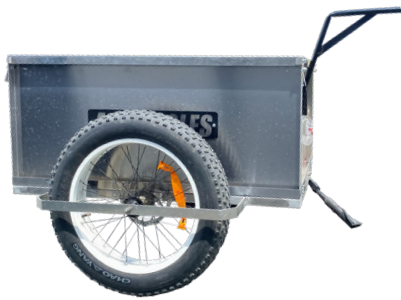
11 Remorque agricole

Cadre acier, ridelles amovibles, surface 130 x 88 cm. Charge max 60 kg. Pneus 20", béquille intégrée. Signalétiques réfléchissantes.