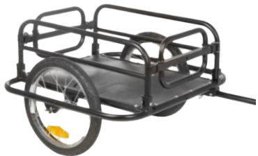
Remorque à ridelles

Cadre en acier, toile étanche, surface de transport 83 x 45 x 38 cm. Charge max 60 kg. Pneus 20" x 4.0, attache sur axe de roue.