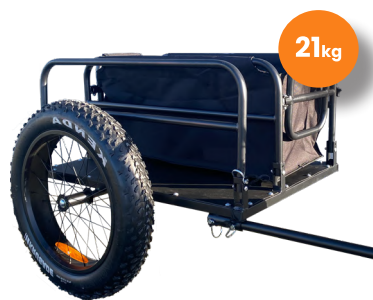
2 Remorque utilitaire

Cadre acier, ridelles amovibles, surface 130 x 88 cm. Charge max 60 kg. Pneus 20", béquille intégrée. Signalétiques réfléchissantes.