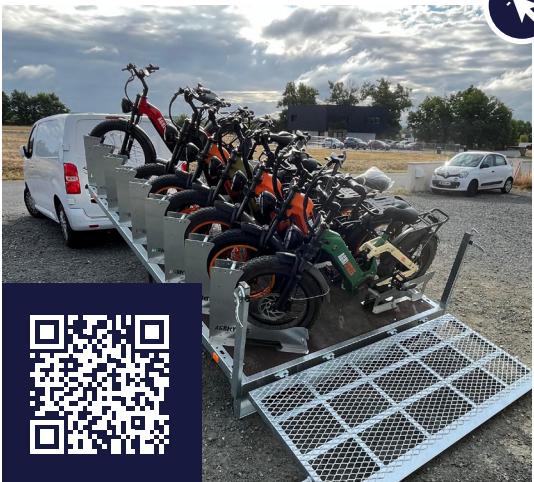
Remorque de transport 9 vélos