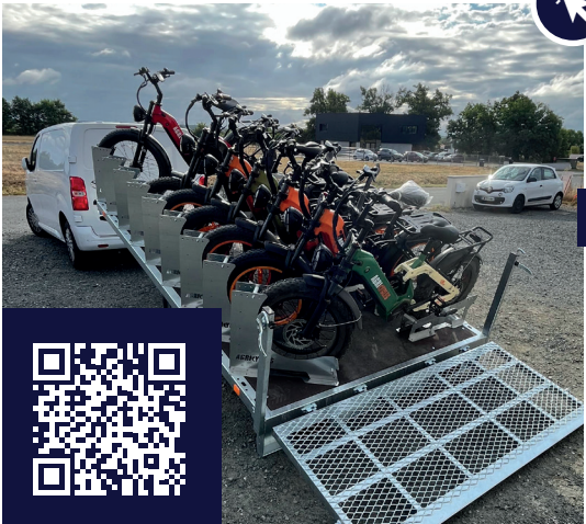
Remorque de transport 9 vélos