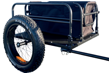
2 Remorque utilitaire

Cadre acier, ridelles amovibles, surface 130 x 88 cm. Charge max 60 kg. Pneus 20", béquille intégrée. Signalétiques réfléchissantes.