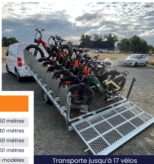
Transporte jusqu'à 17 vélos

Des remorques robustes et faciles à utiliser, spécialement conçues pour transporter en toute sécurité les vélos Agricycles et à pneus larges, idéales pour les professionnels de la location et de l'agrotourisme.