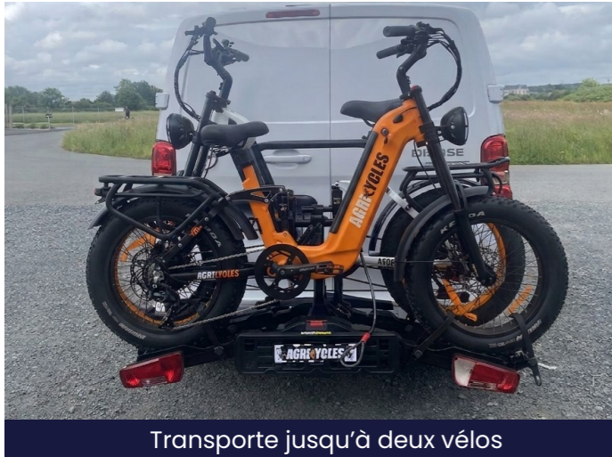
Transporte jusqu'à deux vélos

Un porte-vélo robuste, sécurisé et pratique, capable de transporter deux vélos (jusqu'à 60 kg), tout en offrant un accès facile au coffre et une visibilité optimale sur la route.