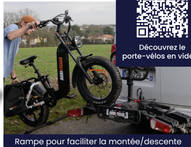
Rampe pour faciliter la montée/descente